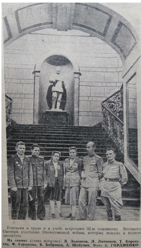
Успехами в труде и в учебе встречают 32-ю годовщину Великого Октября участники Отечественной войны, которых немало в нашем институте.

В архиве есть фото из газеты «Сталинец», где он стоит на лестнице первого корпуса с другими фронтовиками, вернувшимися доучиваться в институт. Его приняли на четвёртый курс. По окончании института поступил в аспирантуру.