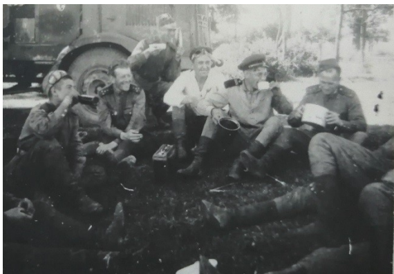
Война войной, а обед по расписанию