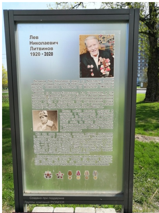
Стелла на аллее Славы у метро Свиблово