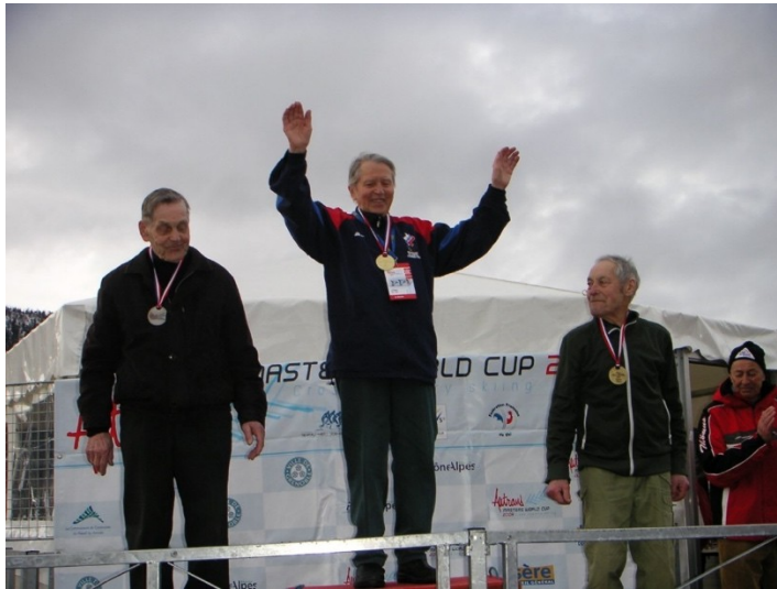
Всегда на пьедестале.