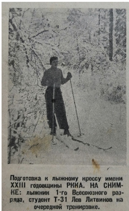
Из газеты «Сталинец», 1940 г