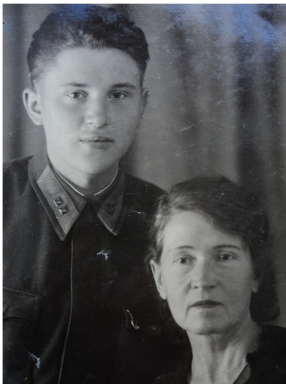
С мамой перед отправкой на фронт